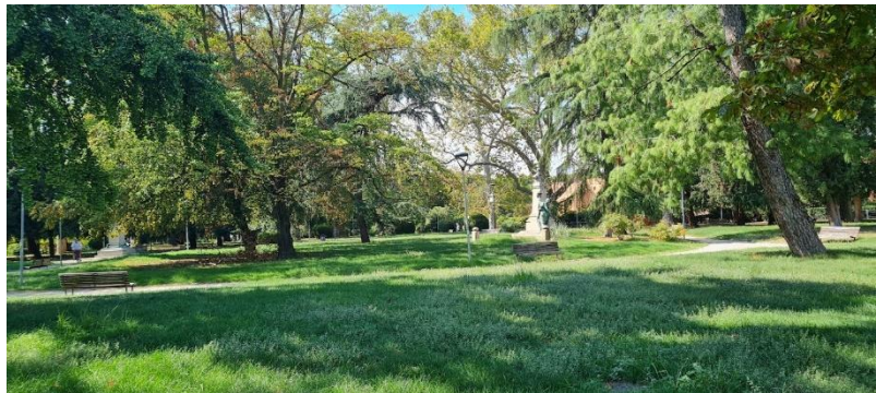
Figura 19: Giardino dei Giusti