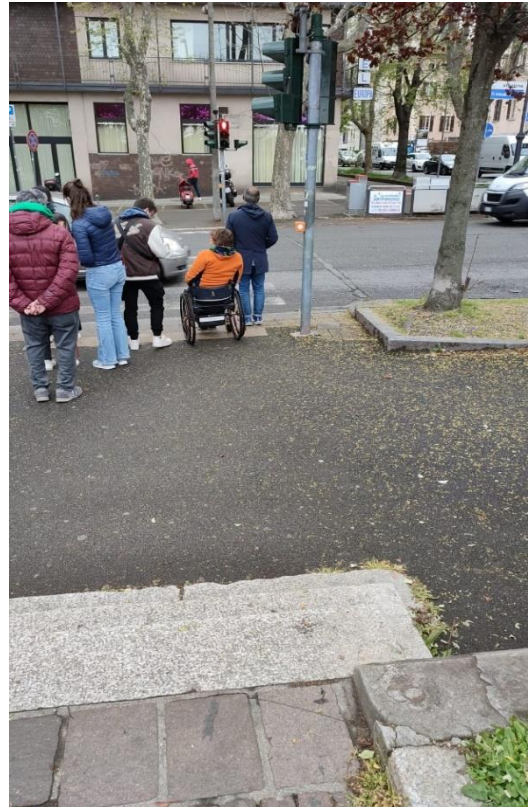
Figura 15: Attraversamento Baluardo La Marmora

All'altezza di corso Giuseppe Mazzini inizia il Baluardo Massimo d'Azeglio. Si prosegue su strada asfaltata fino all'incrocio con Largo Giuseppe Bellini Tornielli. Qui si attraversa sulle strisce pedonali e si percorre il sentiero sotto il viale alberato. Il percorso ha pavimentazione in asfalto e successivamente con piastrelle di pietra regolari.