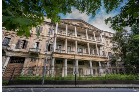
Figura 6: Casa Bossi