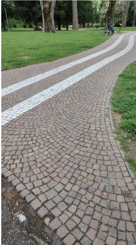
Figura 21: Pavimentazione Giardino dei Giusti