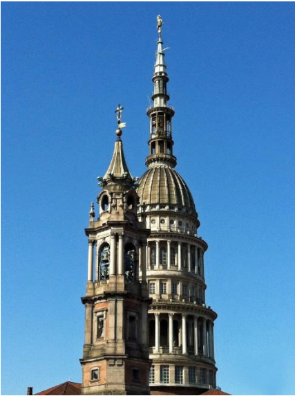
Figura 7: Cupola e Campanile di San Gaudenzio