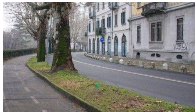
Figura 11: Strada, percorso pedonale e ciclabile lungo Baluardo Quintino Sella