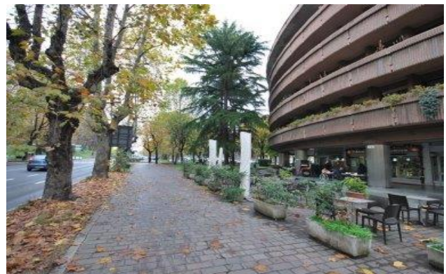
Figura 17: Baluardo Massimo d'Azeglio