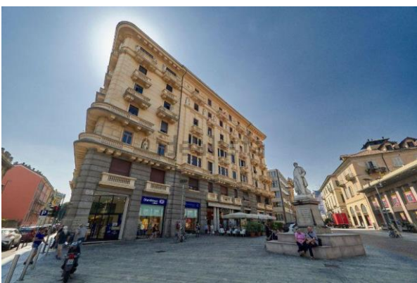
Figura 12: Baluardo dei Partigiani

Superato l'incrocio con via Gian Battista Ploto riprende il viale alberato e l'area in cui si passeggia è chiaramente divisa in zona ciclabile e zona pedonale, contrassegnata da segnaletica orizzontale sull'asfalto.