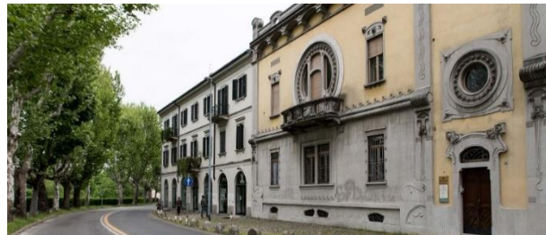
Figura 8: Casa Rosina

All'incrocio con via Pier Lombardo si possono vedere sullo sfondo il frontone e la cupola Gaudenziana.