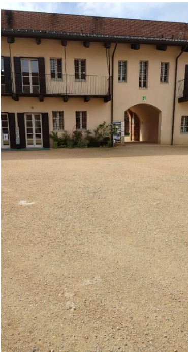
Figura 4: Cortile castello e sede dell'ATL