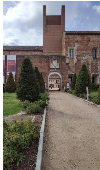
Figura 3: Strada per il castello di Novara da Piazza Martiri della Libertà