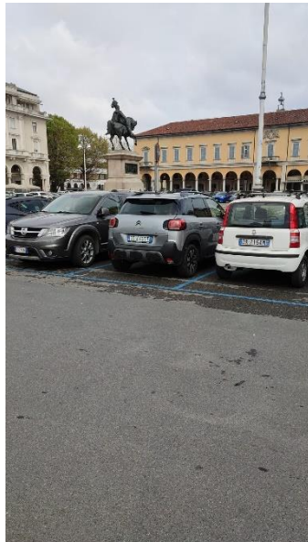
Figura 2: Parcheggio Piazza Martiri della Libertà