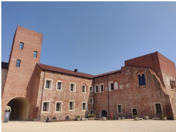
Figura 23: Cortile interno Castello di Novara