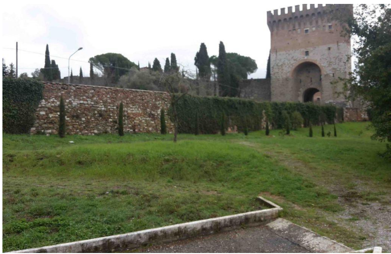
Figura 20: Giardino dei Giusti