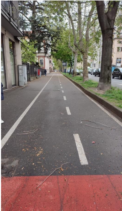
Figura 14: Baluardo La Marmora

Presso Largo San Lorenzo inizia il Baluardo La Marmora, che prosegue sempre su strada asfaltata nel viale alberato, con attraversamenti su strisce pedonali.