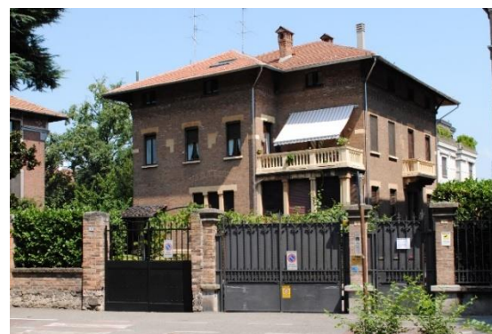
Figura 13: Ciclabile lungo Baluardo dei Partigiani