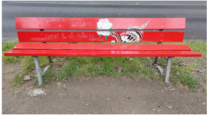
Figura 9: Panchina lungo Baluardo Quintino Sella