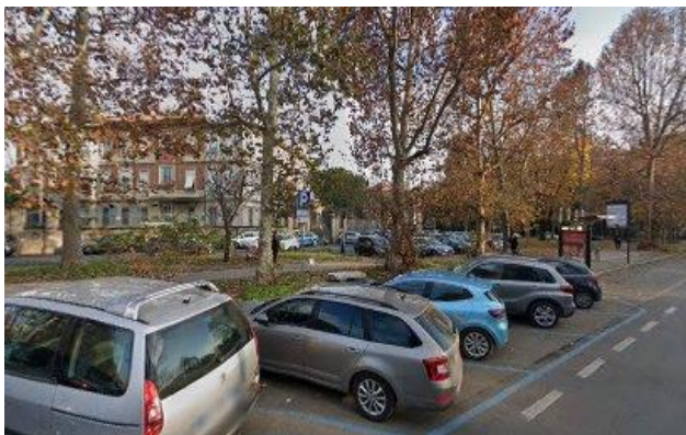
Figura 16: Parco del Socio

All'altezza di corso Giuseppe Mazzini inizia il Baluardo Massimo d'Azeglio. Si prosegue su strada asfaltata fino all'incrocio con Largo Giuseppe Bellini Tornielli. Qui si attraversa sulle strisce pedonali e si percorre il sentiero sotto il viale alberato. Il percorso ha pavimentazione in asfalto e successivamente con piastrelle di pietra regolari.