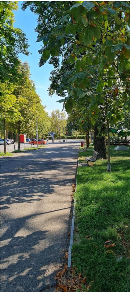
Figura 18: Ingresso Giardino dei Giusti

Il sentiero nel giardino è in cubetti di porfido. Sulla destra si percorre poi un ponte, con pavimentazione in assi di legno disposte perpendicolarmente al senso di percorrenza, che si collega al cortile del Castello Visconteo Sforzesco, sede dell'ATL di Novara. La pavimentazione è qui irregolare con superficie in ghiaietto, rendendo un po' difficoltoso il passaggio di una carrozzina autospinta.