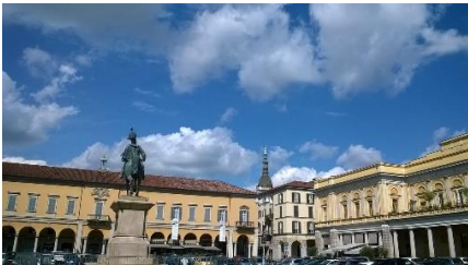
Figura 1: Piazza Martiri della Libertà

Lungo il primo tratto, caratterizzato da una bellezza d'insieme di tipo naturalistico e architettonico, si possono ammirare verso destra la cupola e il campanile di San Gaudenzio sullo sfondo, la Casa Rosina in stile liberty e la neoclassica casa Bossi.