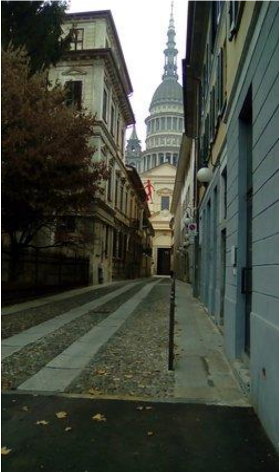
Figura 10: Incrocio via Pier Lombardo

Giunti a Corso della Vittoria (pavimentazione regolare in porfido), dopo Largo Cavour inizia il Baluardo dei Partigiani. La pavimentazione inizialmente è in lastre di pietra, poi diventa nuovamente asfaltata, sempre in piano e abbastanza facilmente percorribile.