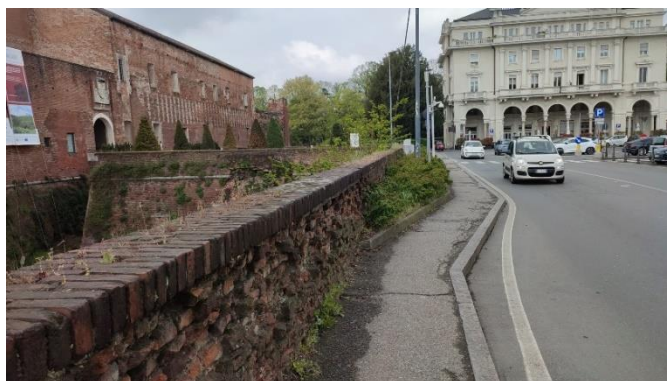
Figura 5: Strada verso Baluardo Quintino Sella